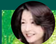
仲道郁代