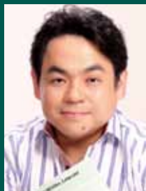
下野竜也

第49回 2014年 4月12日 (土) 11:00開演(10:30開場) 「音楽の都ウィーン」(管弦楽) 指揮:下野竜也 ピアノ:仲道郁代* ウェーベルン:管弦楽のための6つの小品 から R.シュトラウス:組曲『ばらの騎士』抜粋 スッペ:序曲『ウィーンの朝、昼、晩』 モーツァルト:ピアノ協奏曲第23番 から 第2楽章* ベートーヴェン:交響曲第7番 から 第1楽章