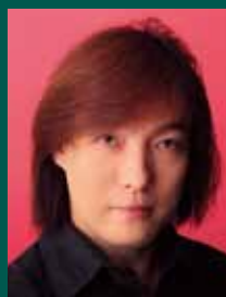
飯森範親 © Junichi Ohno

第51回 2014年 9月6日 (土) 11:00開演(10:30開場 10:40~プレトーク) 「オペラっておもしろい」(オペラ) 指揮:三ツ橋敬子 ソプラノ:馬原裕子 バリトン:鹿野由之 合唱:東響コーラス、東京少年少女合唱隊 ロッシーニ:オペラ『ウィリアム・テル』序曲 ドニゼッティ:オペラ『愛の妙薬』から プッチーニ:オペラ『ラ・ボエーム』から ヴェルディ:オペラ『アイダ』から「凱旋の行進」 *こどもレセプション体験