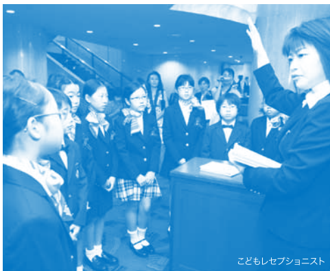
こどもレセプション