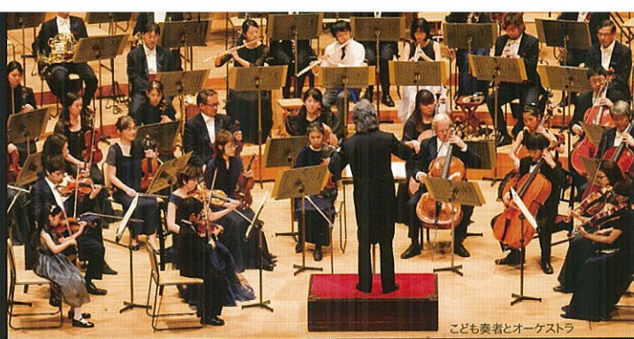
こども奏者とオーケストラ

第45回 2013年4月6日(土) 11:00開演 (10:30開場) 『弦楽器の調べ』