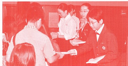
こどもレセプション