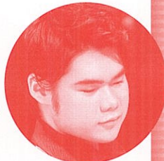
ピアノ: 辻井伸行 (7/6出演)