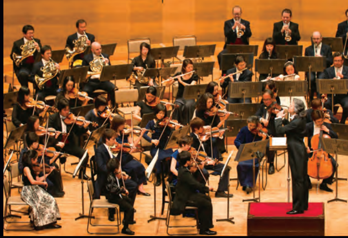
こども奏者とオーケストラ