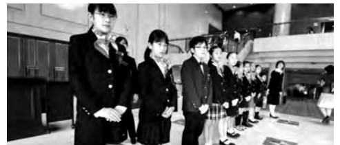
こどもレセプション