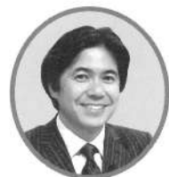
司会：坪井直樹 (テレビ朝日アナウンサー)

開演前に子ども定期をより楽しむことができる「プレトーク」を開催しています。 開場時間中(10:40~10:50)に大ホールにて開催。